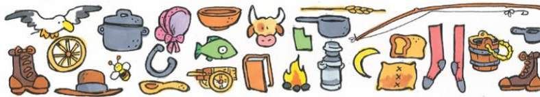
Illustration von Val Chadwick Bagley