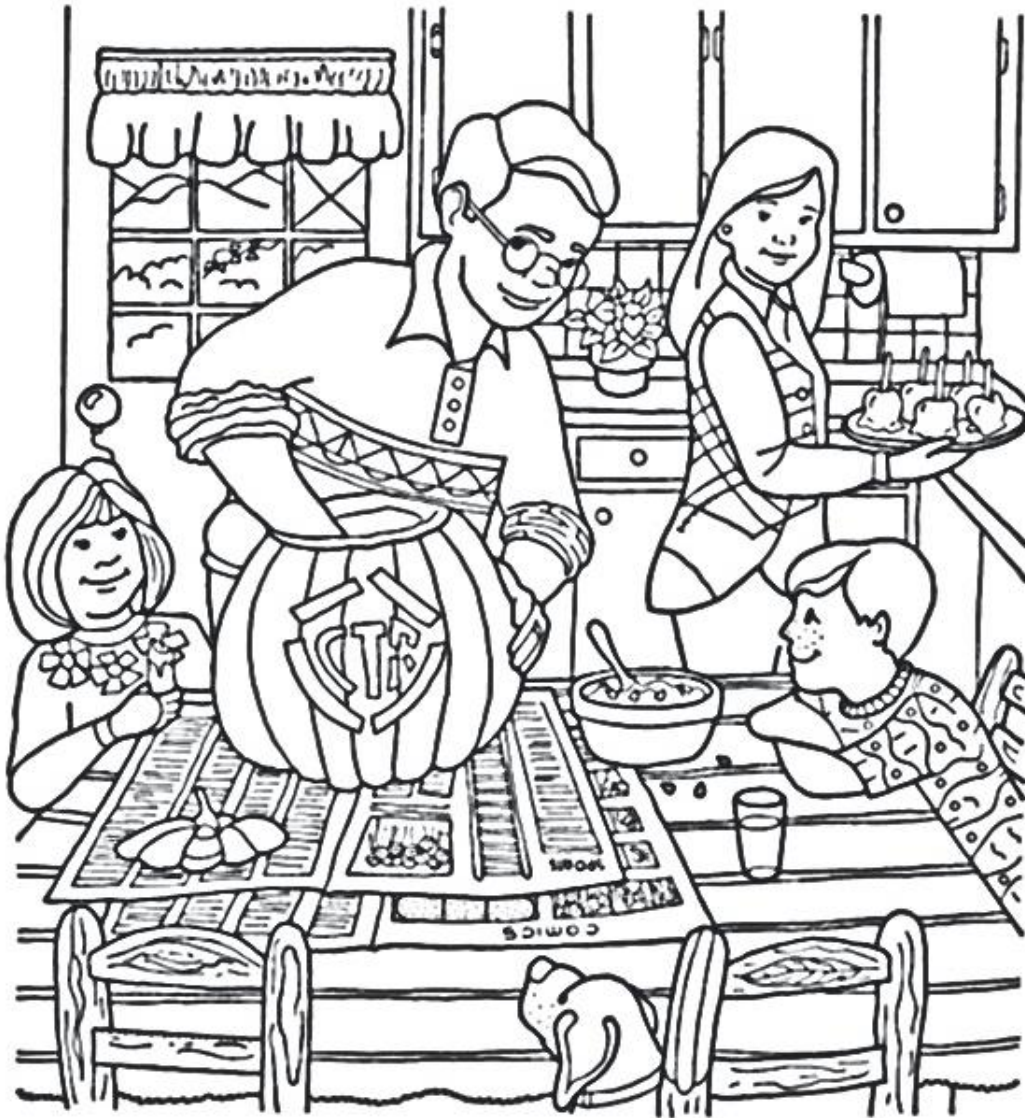
Illustration von Linda Mahood Morgan