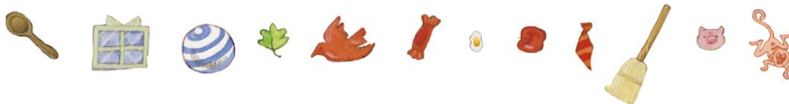
Illustration von Miki Sakamoto